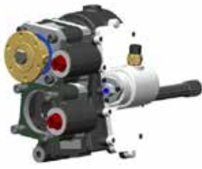
Yeni çift çıkışlı ağır hizmet PTO