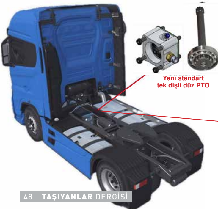
Yeni standart tek dişli düz PTO